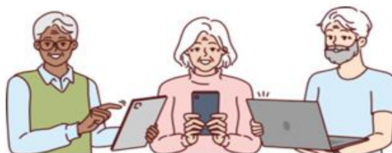
Tablette tactile Smartphone Ordinateur

N'attendez plus, prenez rendez-vous gratuitement dans votre commune !